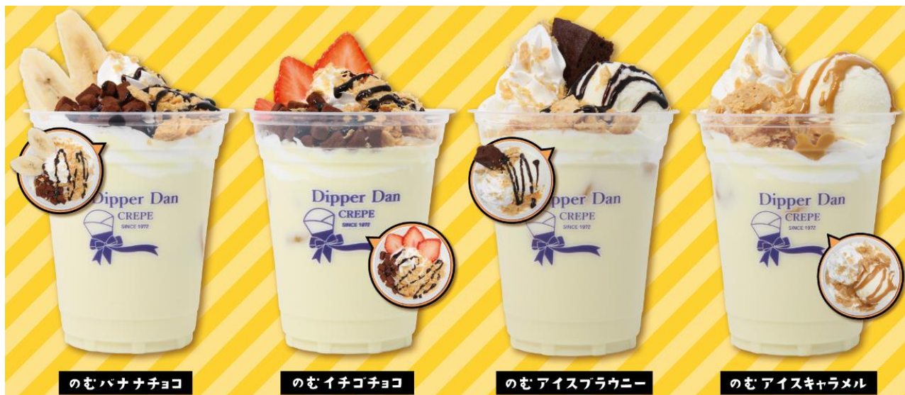
のむバナナチョコ