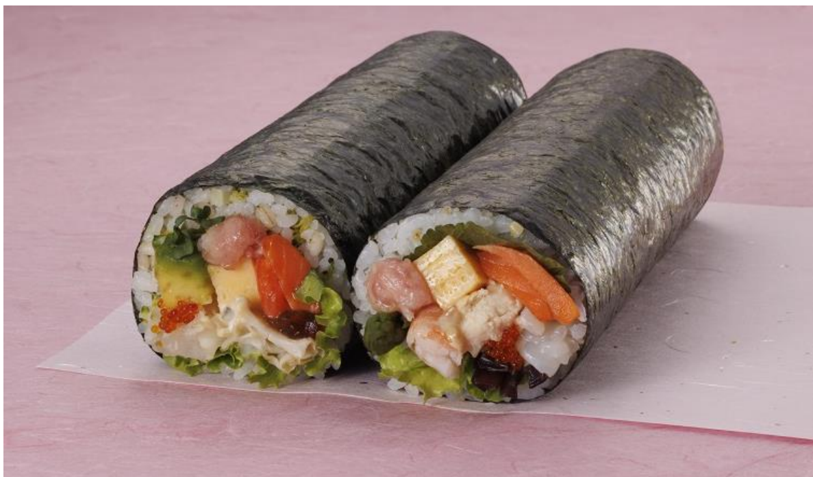
左：カラダキレイ美人巻 右：カラダスリム美人巻