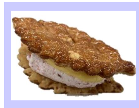
当社オリジナルのスイーツ