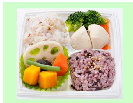
「塩分控えめの和風だし雑穀米弁当」

ライスにのせたローストビーフの上にはホワイトソース。さらに温泉卵を添えたコク深いカレー