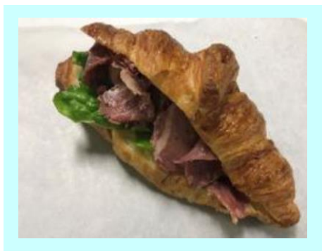
ワンハンドメニュー

食塩相当量を従来より抑え、和風だしで炊き込んだ鶏肉や煮物を栄養豊富で腹持ちも良い雑穀米と合わせたヘルシー弁当