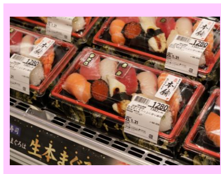
生本まぐろを使用した