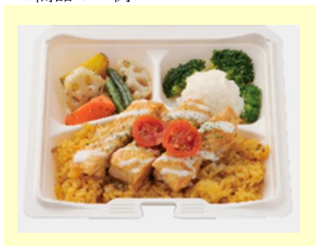
「チキンオーバーライス」

キッチンカー風のBOXを開けるとスパイスが香る柔らかいタンドリーチキンが食欲をかきたてる