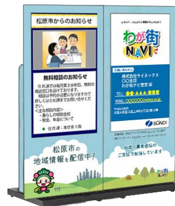
※わが街NAVIイメージ図

また、災害時には松原市より発信される情報を表示し、地域のお客さまにいち早くご案内します。