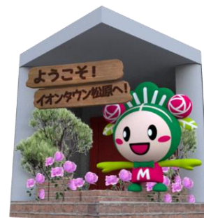
※コンテンツイメージ