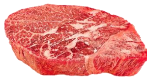
「さつま姫牛」のステーキ

＜高性能な急速冷凍機を使用した商品の一例＞ 冷凍していない同商品と同じ価格で展開。