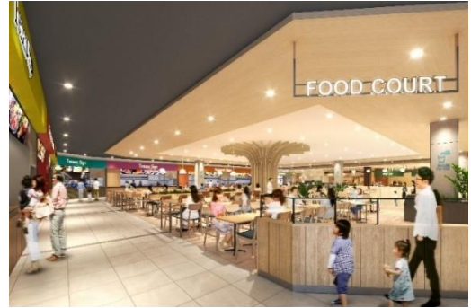
※新堂キッチンイメージ

大阪府初出店2店舗、松原市初出店1店舗 をはじめ合計6店舗が出店するフードコート。 明るく開放的な314席のフードコートには、 お子さま連れに嬉しい小上がり席やキッズエリアも 配置、人気のグルメをゆっくりとお楽しみいただけます。