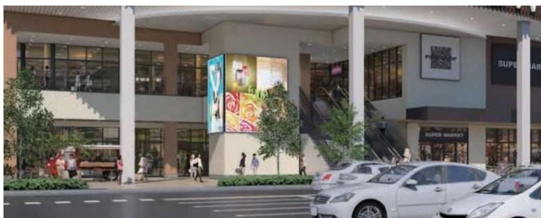
※大型LEDビジョンイメージ

※松原市マスコットキャラクター「マッキー」の3Dコンテンツは毎時0分（7時～22時）の放映を予定しております。