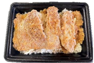
店内調理した「かつ丼」