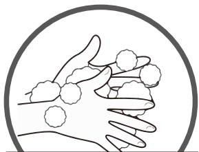
①てのひらをあらう