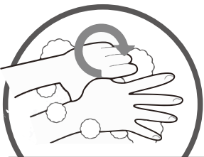
⑤おやゆびを あらう