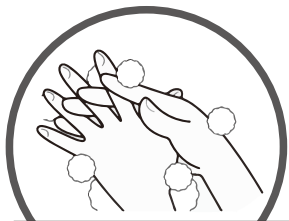
④ゆびのあいだを あらう