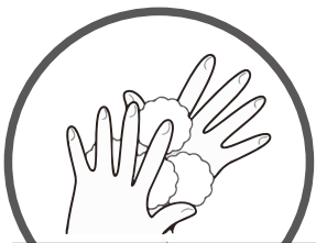
②てのこうをあらう